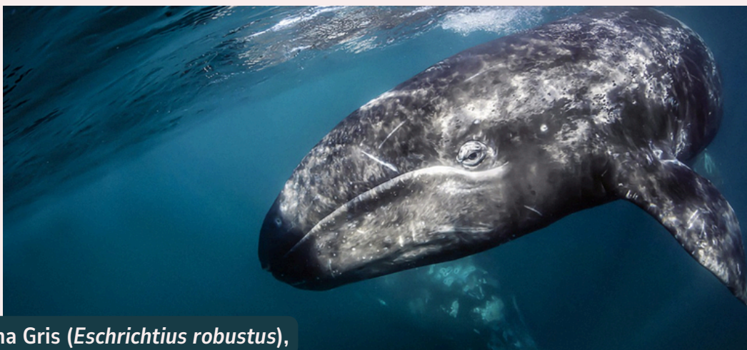
Ballena Gris ( Eschrichtius robustus )

El objetivo de este trabajo es comprender el uso que le dan estos gigantes al territorio mexicano a través de una revisión de los estudios previos que existen acerca de la migración de ballena gris durante el invierno, puesto que lo anterior resulta esencial para el desarrollo de estrategias adecuadas para la protección de la especie. Para ello nos enfocaremos en tres aspectos: la alimentación, las zonas de distribución, así como el uso que hacen de éstas; y la abundancia.