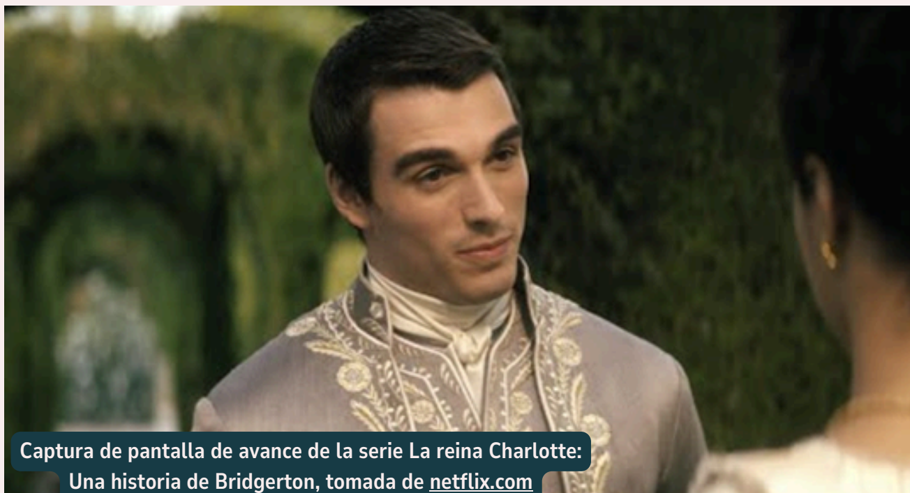
Captura de pantalla de avance de la serie La reina Charlotte: Una historia de Bridgerton, tomada de netflix.com

Ha sido gratificante observar al mismísimo Rey de Inglaterra desde su aureola de grandeza y magnanimidad en esta condición doble de la razón y la locura, fluctuando entre dos mundos, en un vaivén de dos seres que luchaban entre sí tratando de destronar al monarca y ahogar al ser humano. Este testimonio cinematográfico es apenas un asomo a la otra historia que todavía no ha sido contada y una forma de observar desde otros ángulos los personajes de mármol. Explorar la salud mental de estas figuras históricas y otras es un camino para desmitificarlas y percatarnos que debajo de esas coronas yacen mentes que hasta el día de hoy no han sido descifradas. Además de sus obras y su legado, se encuentra un mundo lleno de misterios y enigmas.