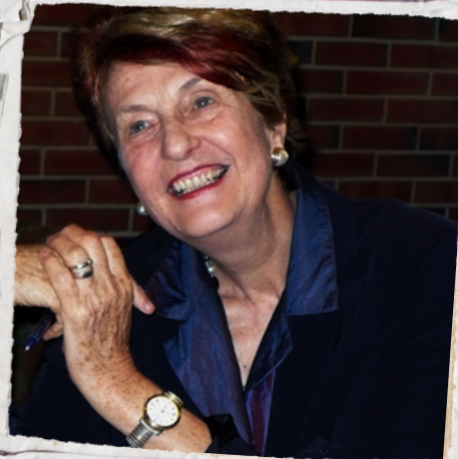
Helen Mary Caldicott (1938 - )

Botánica neozelandesa, fue la primera curadora mujer de Nueva Zelanda, en el Museo de Auckland.